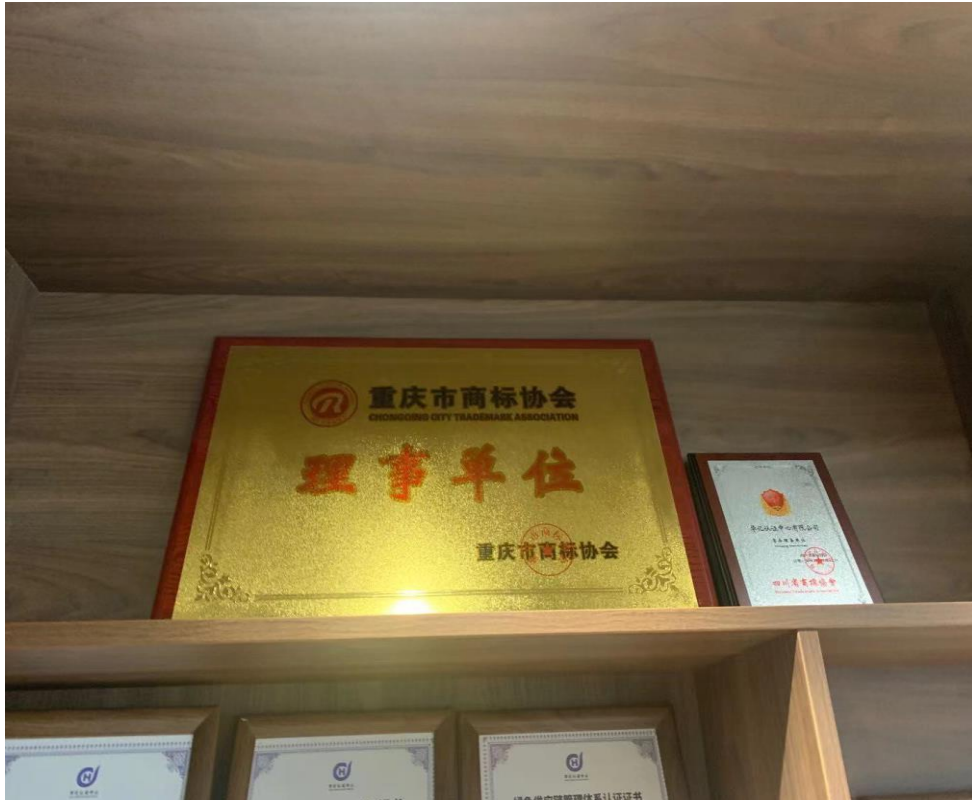
加入重庆市商标协会成为理事单位